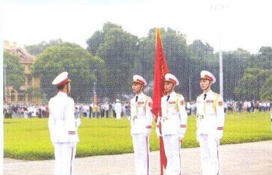
Hình 23a (cầm cờ)