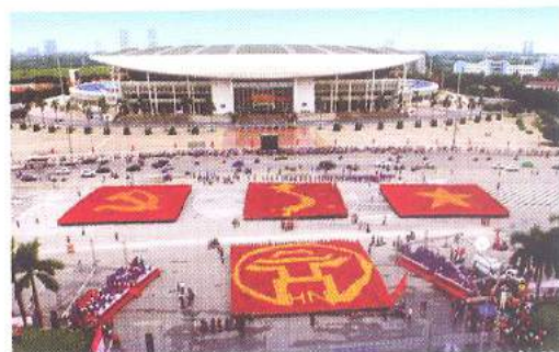
Hình 32 (xếp bằng người)