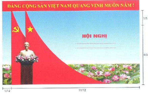
Hình 5c (cờ xếp chéo đôi)