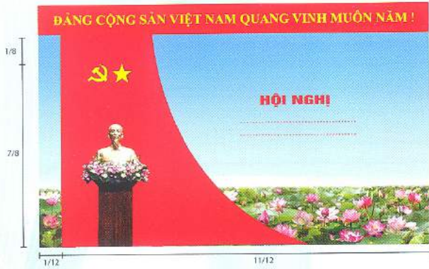
Hình 5b (cờ xếp chéo đơn)