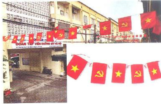
Hình 16b (cờ dây)