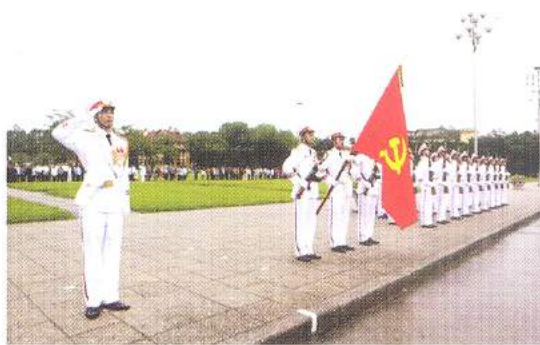
Hình 23b (giương cờ)