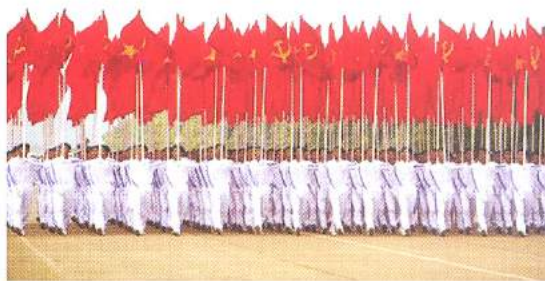
Hình 24b (rước theo hàng)