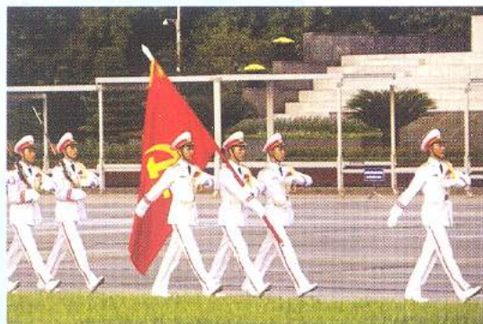
Hình 23c (vác cờ)