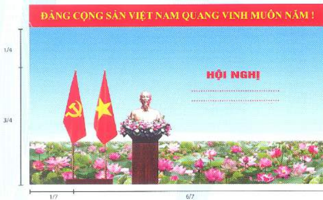
Hình 2 (Cờ cố bản)