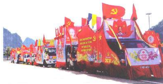
Hình 24d (rước bằng xe)