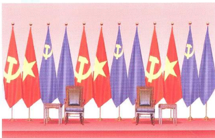
Hình 22 - (2 cờ màu tím là minh họa cờ Đảng và Quốc kỳ nước khách)

Điều 12. Nơi tổ chức các hoạt động đối ngoại đảng, ngoại giao nhà nước