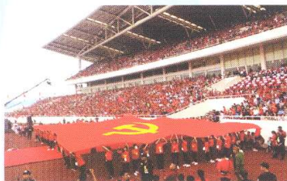
Hình 24a (rước cờ vai)