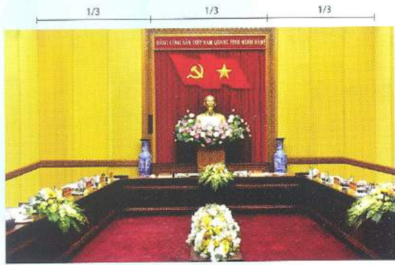
Hình 4b (kích thước hội trường nhỏ)