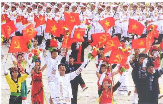
Hình 23d (vẫy bằng tay)