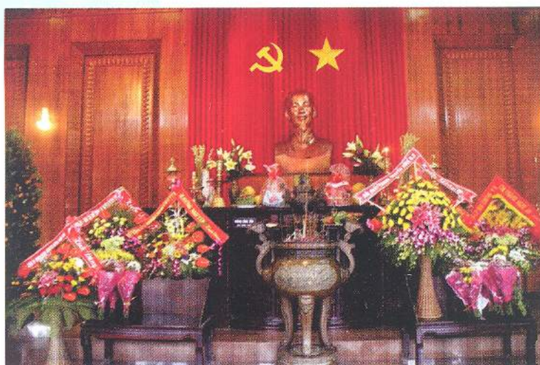
Hình 21c - Trong đền thờ chính

Điều 12. Nơi tổ chức các hoạt động đối ngoại đảng, ngoại giao nhà nước