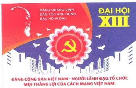
Hình 31b (panô tuyên truyền)