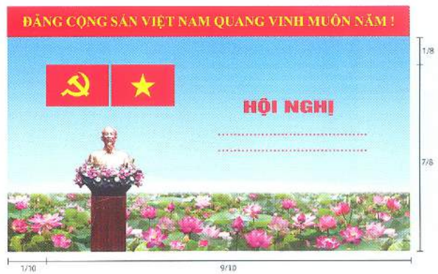
Hình 3a (cờ không tạo sóng)