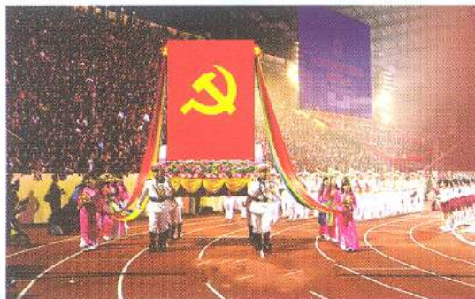
Hình 24c (rước trên kiệu)